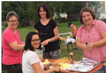
Vielen Dank an die Helfer