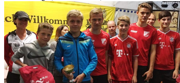
Jugend - 1. Platz bei der Übergabe von T-Shirt und Pokal.