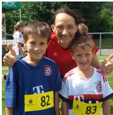
Glücklich im Ziel